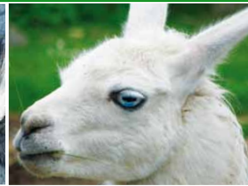
▲ Das große Tierparkfest erfreut sich jährlich wachsender Besucherzahlen. Aktuelle Veranstaltungstermine finden Sie auf www.arnstadt.de .