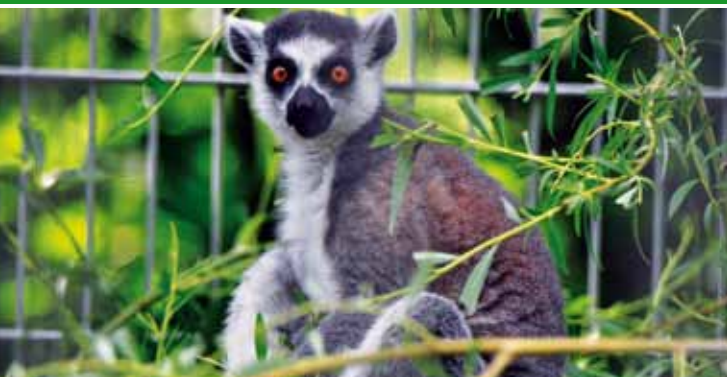
▲ Der Katta ist ursprünglich in Madagaskar zuhause und ist dank seines gekringelten Schwanzes unverwechselbar.