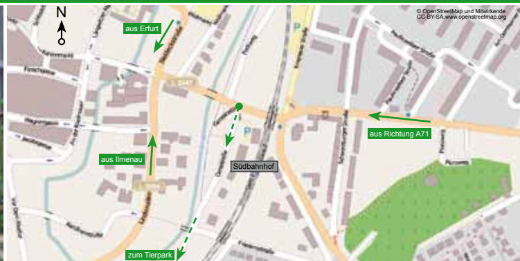
▲ Anfahrt zum Tierpark Fasanerie Arnstadt Bitte beachten Sie, dass am Tierpark nur eine begrenzte Anzahl an Parkplätzen verfügbar ist.